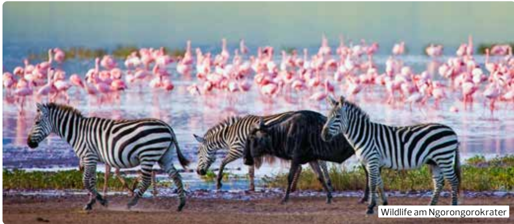
Wildlife am Ngorongorokrater