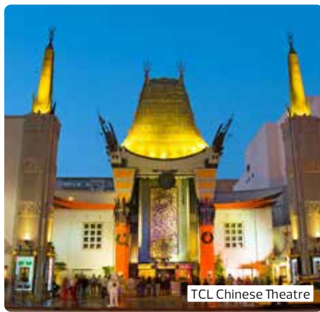
TCL Chinese Theatre