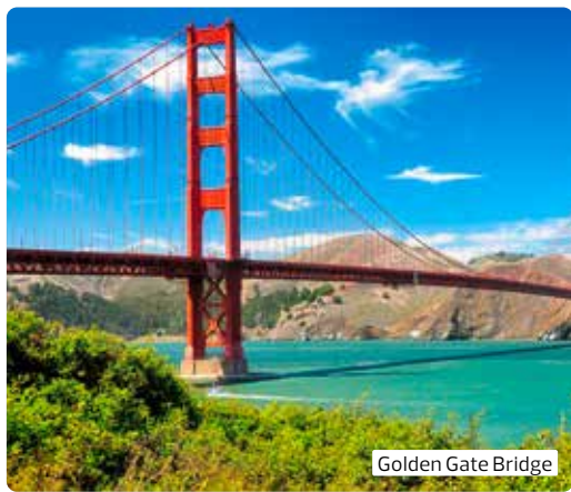
Golden Gate Bridge